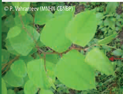
Feuilles de R. japonica

Tige creuse, cylindrique, noueuse, tachetée de rouge sombre