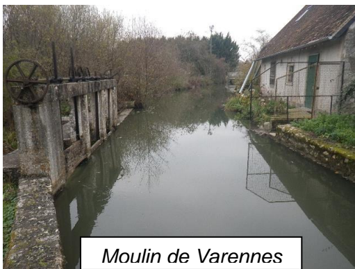
Moulin de Varennes