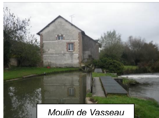
Moulin de Vasseau